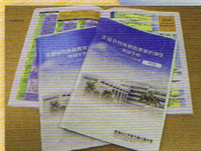
支援有特殊教育需要的學生